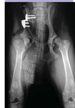
Röntgenaufnahme: HD Korrektur mit DBO im Alter von 10 Monaten.

Rein äußerlich ist eine Hüftgelenkdysplasie (HD) leider weder mit Sicherheit zu diagnostizieren noch auszuschließen. Hinweise können Bewegungsunlust, eiernder Gang oder Lahmheiten nach längerer Belastung sein. Es handelt sich bei der Hüftgelenkdysplasie um eine zum großen Teil genetisch bedingte Fehlentwicklung des Hüftgelenks.