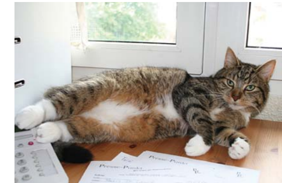
Kater Elvis kann sich optimal platzieren.

„Ja, dann wollen wir mal ...“ Langsam erhebe ich mich morgens aus den Federn, das Bett ist noch schön kuschelig warm, aber schließlich ist es ein Wochentag und ich muss früh raus.