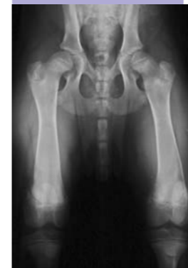
Röntgenaufnahme: HD und lockere Hüfte im Alter von 14 Wochen.