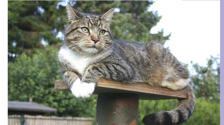
Kater Elvis vermisst die Mäuse.

Es ist wie verhext: seit Tagen habe ich keine einzige Maus gefangen! Okay, mein Revier beschränkt sich zwar nur auf unseren Garten, aber in den vergangenen Monaten hat sich regelmäßig ein kleines dummes Nagetier im Garten verirrt. Doch jetzt ist kein einziges weit und breit zu sehen! Sollten die winzigen Gesellen dazu gelernt haben? Sind sie intelligenter geworden oder haben sie sich gar abgesprochen? Ich weiß es nicht.