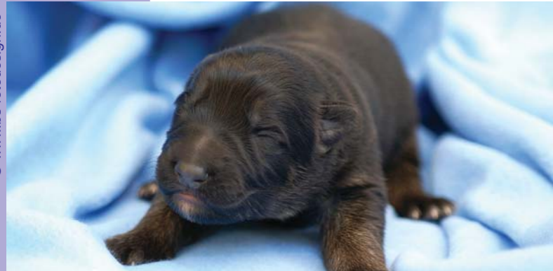
Wenn Sie sich für einen Welpen entscheiden: Handeln Sie überlegt und wenden Sie sich nur an anerkannte Züchter.

► Kaufen Sie auf gar keinen Fall dort, wo mehrere Rassen angeboten wer-