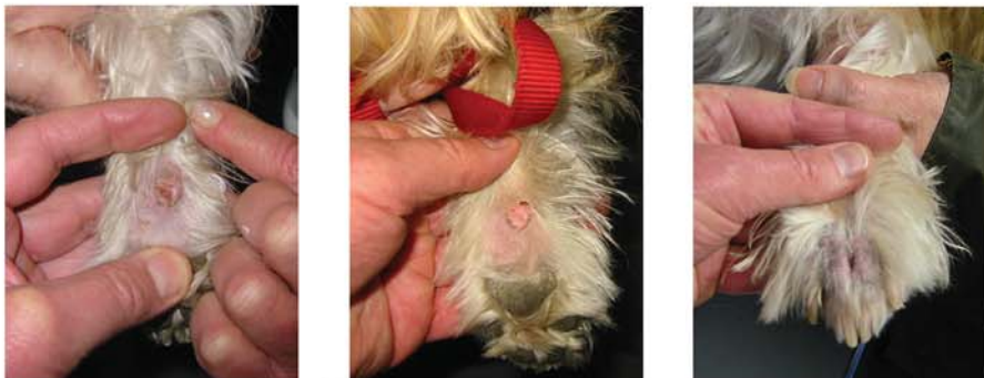
Bilderserie: Ein entzündlicher Hauttumor. Leicht lässt er sich mittels Laserchirurgie entfernen, sogar ohne Allgemeinnarkose!